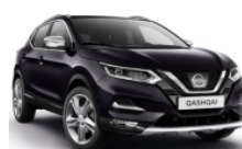
ТЪМНО ЛИЛАВ (M) - GAB