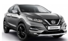
ТЪМНО СИВ (M) - KAD