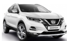
БЯЛ (C) - 326