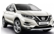
БЯЛ (M) - QAB