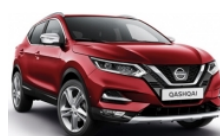
ЧЕРВЕН (M) - NAJ