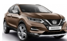
БРОНЗОВ (M) - CAN