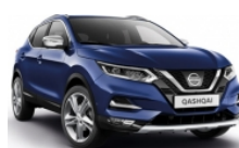
ТЪМНО СИН (M) - RBN