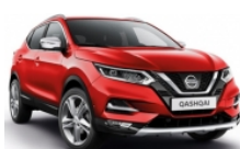
ЧЕРВЕН (C) - Z10