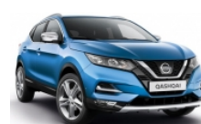
СИН (M) - RCA

► Доплащане за цвят металик (M): 850 лв с ДДС.