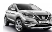
СРЕБЪРЕН (M) - KYO