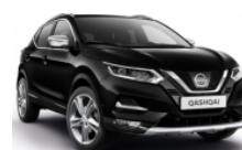
ЧЕРЕН (M) - Z11