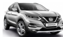
СРЕБЪРЕН (M) - KYO