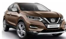
БРОНЗОВ (M) - CAN