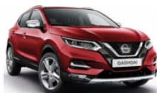
ЧЕРВЕН (M) - NAJ