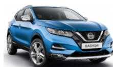
СИН (M) - RCA

► Доплащане за цвят металик (M): 850 лв с ДДС.