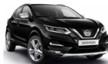
ЧЕРЕН (M) - Z11