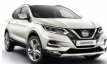
БЯЛ (M) - QAB