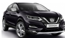
ТЪМНО ЛИЛАВ (M) - GAB