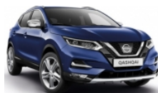
ТЪМНО СИН (M) - RBN