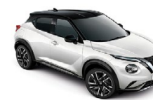
ПЕРЛЕНО БЯЛ С ЧЕРЕН ПОКРИВ (M) XKJ