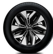
17" СТОМАНЕНИ ДЖАНТИ С ДЕКОРАТИВНИ ТАСОВЕ