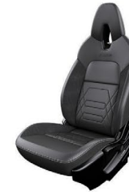
СИНТЕТИЧНА КОЖА И АЛКАНТАРА