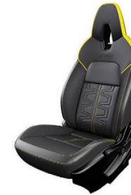
СИНТЕТИЧНА КОЖА И АЛКАНТАРА