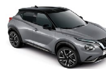
ПЕРЛЕНО СИВ С ЧЕРЕН ПОКРИВ (M) XEX