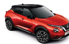
ОРАНЖЕВО ЧРВЕН С ЧЕРЕН ПОКРИВ (M) YAU