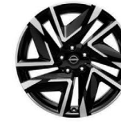
19" АЛУМИНИЕВИ ДЖАНТИ