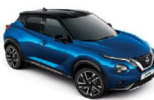
СИН С ЧЕРЕН ПОКРИВ (M) XGZ

► Доплащане за цвят металик (M): 750 лв с ДДС.