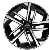
17" АЛУМИНИЕВИ ДЖАНТИ