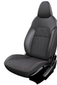
ТЕКСТИЛ И СИНТЕТИЧНА КОЖА