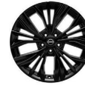
19" АЛУМИНИЕВИ ДЖАНТИ