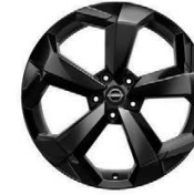
19" АЛУМИНИЕВИ ДЖАНТИ