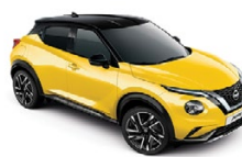
ЖЪЛТ С ЧЕРЕН ПОКРИВ (M) YAS