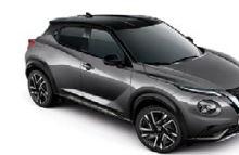
ТЪМНО СИВ С ЧЕРЕН ПОКРИВ (M) GAQ